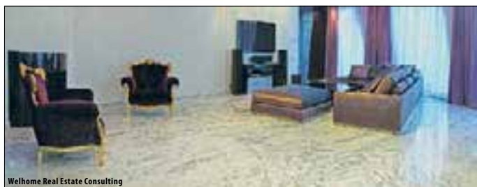
Welhome Real Estate Consulting